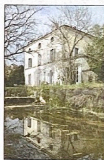
La Maison Latour Marliac

Pour ce faire une association de préfiguration a été