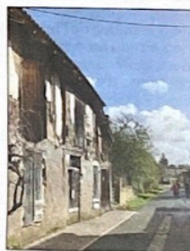
La maison du boulanger

créée et chacun peut d'ores et déjà participer à l'élaboration du projet.