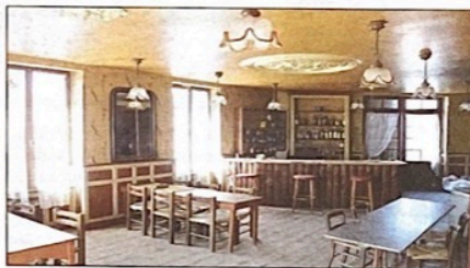
L'ancienne auberge fermée depuis 20 ans va revivre

L'ancienne auberge du village fermée depuis 20 ans deviendra l'auberge du botaniste.