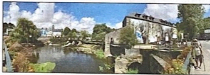
Un endroit rêvé pour les artistes

La maison du boulanger avec son four à pain et sa boutique pourrait devenir un tier lieu accueillant d'échange et de partage.